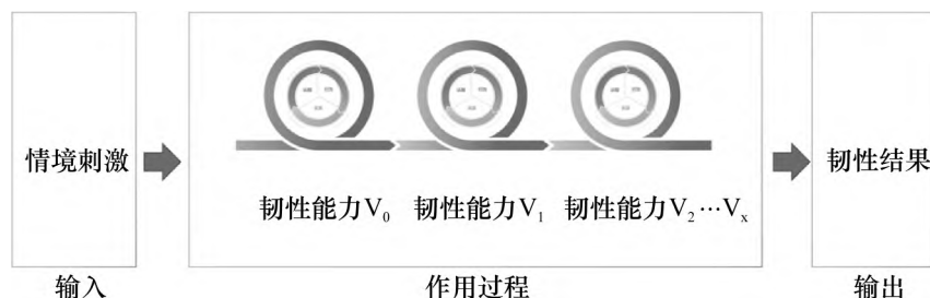
图 2 组织的韧性和韧性过程